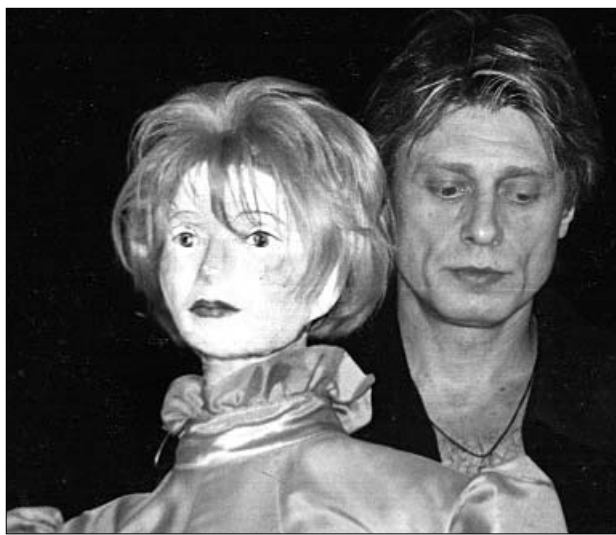
Не случилось сыграть Гамлета... Зато вот он — всероссийский, всемосковский и все тамбовский Дон Жуан. А если серьезно — одна из любимейших ролей актёра.